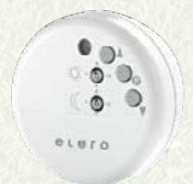
Lumo-868 Funksensor für Licht, Dämmerung und Glasbruch