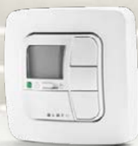
AstroTec-868 1-Kanal-Funkwandsender mit Astro-, Zeit- und Urlaubsfunktion

Sensoren und Zeitsteuerung machen Rollläden intelligent: Sie öffnen und schließen in Abhängigkeit von Wetter und Tageszeit. Bei aktivierter Astrofunktion bewegt sich Ihr Sicht- und Sonnenschutz zu den Sonnenauf- und -untergangszeiten.