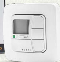
AstroTec-868 1-Kanal-Funkwandsender mit Astro-, Zeit- und Urlaubsfunktion