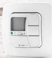
AstroTec Bedrahtete Steuerung mit Zeitschaltuhr und Astroprogramm

Die praktischen Komfort- und Automatikfunktionen erhalten Sie natürlich auch als bedrahtete Steuerungen zur Wandmontage – passend zu den Schalterprogrammen führender Hersteller.