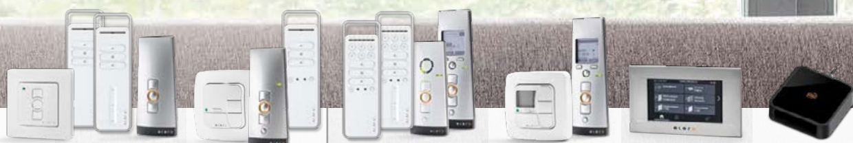
MonoTec-868 MonoCom MonoCom Slide MonoTel 2

Mit den bedienfreundlichen elero Steuerungen lassen sich automatische Rollläden einfach und bequem betätigen. elero Funkhandsender zeichnen sich durch ein zeitloses Design aus: Die bedrahteten Steuerungen lassen sich in viele handelsübliche Schalterprogramme integrieren. Mit der Automatisierungslösung Centro Home und der eigens dafür entwickelten App, in der die eingelernten Geräte automatisch erscheinen, können gleich mehrere Benutzer parallel via Smartphone oder Tablet die Rollläden und andere Haustechnikgeräte steuern – sowohl von zu Hause als auch von unterwegs. Die Art der Bedienung und der Automatisierungsgrad richten sich nach Ihren Bedürfnissen und Wünschen.