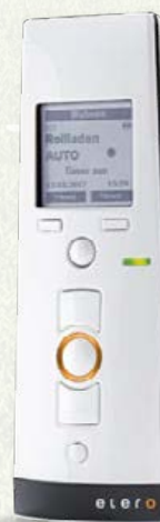
TempoTel 2 10-Kanal-Handsender mit Astro-, Zeit- und Urlaubsfunktion

elero Antriebe mit festen Wellenverbindern erschweren das Hochschieben des Rollladens erheblich. Steuerungen mit Zeitfunktion sorgen dafür, dass Ihre Rollläden abends zuverlässig schließen. Nichts kann vergessen werden. Durch eine optische Anzeige am Sender wird der ausgeführte Befehl für die Bewohner nachvollziehbar – dafür sorgt die bidirektionale Funktechnologie mit Rückmeldung. Bei längerer Abwesenheit aktivieren Sie ganz einfach das integrierte Urlaubsprogramm Ihrer elero Steuerung. Die Rollläden am Haus öffnen und schließen jetzt mit geringer Zeitabweichung – Ihr Zuhause wirkt bewohnt und schreckt potentielle Einbrecher ab.